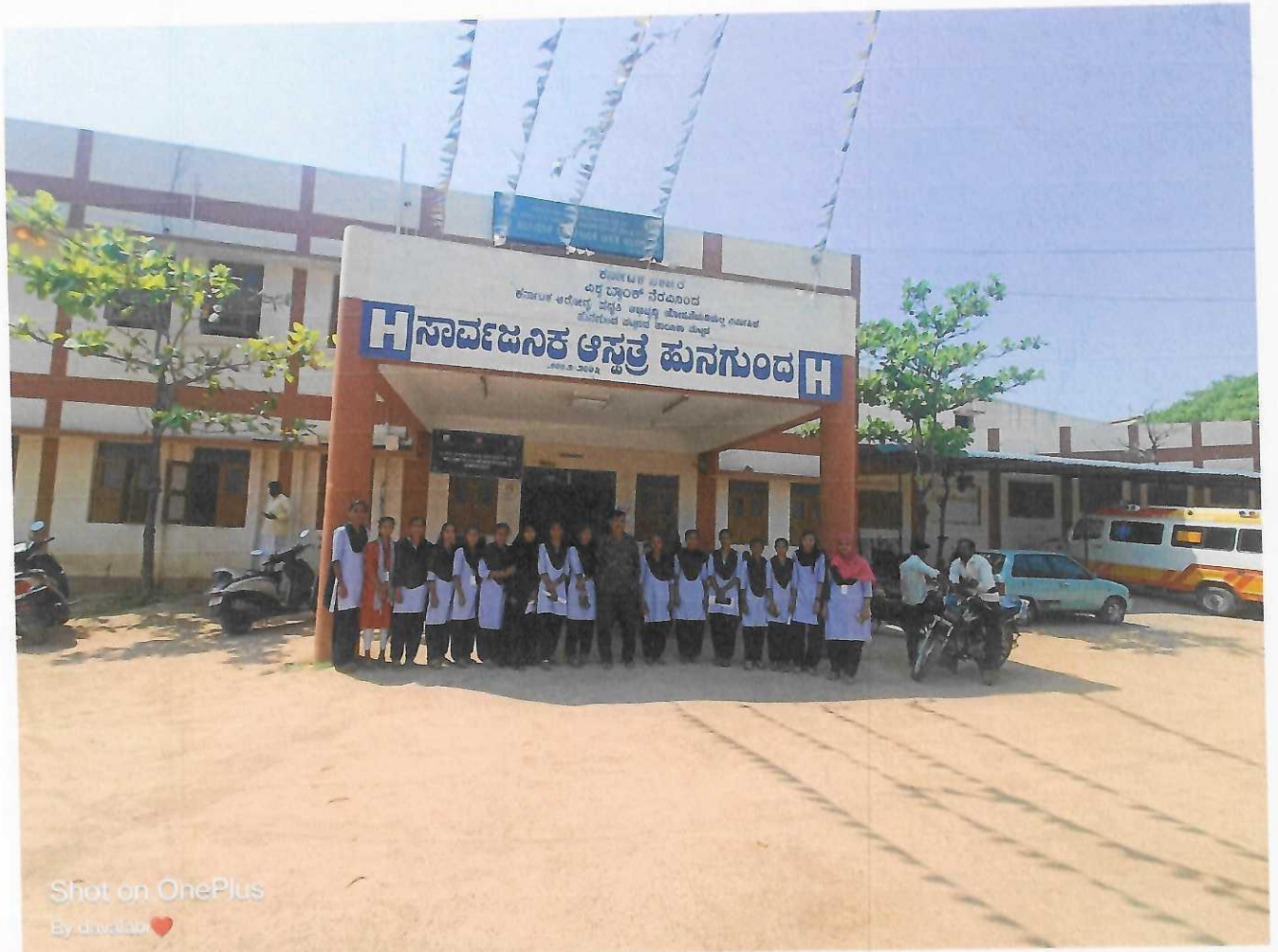
Shot on OnePlus By dhwilab ❤️