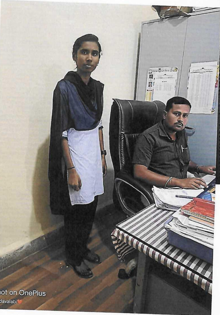
Shot on OnePlus