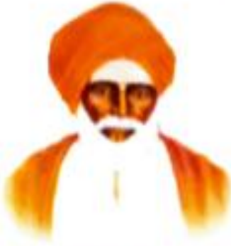
ಶ್ರೀ ವಿಜಯಮಹಾಂತೇಶ ತಿಪಯೋಗಿಗಳು ಚಿತ್ರರಂಗಿ ಸಂಸ್ಥಾನಮತ, ಇಲಕಲ್ಲ