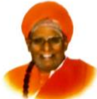
ಶ್ರೀ ಮಹಾಂತ ತಿಪಯೋಗಿಗಳು ಚಿತ್ರರಂಗಿ ಸಂಸ್ಥಾನಮತ, ಇಲಕಲ್ಲ