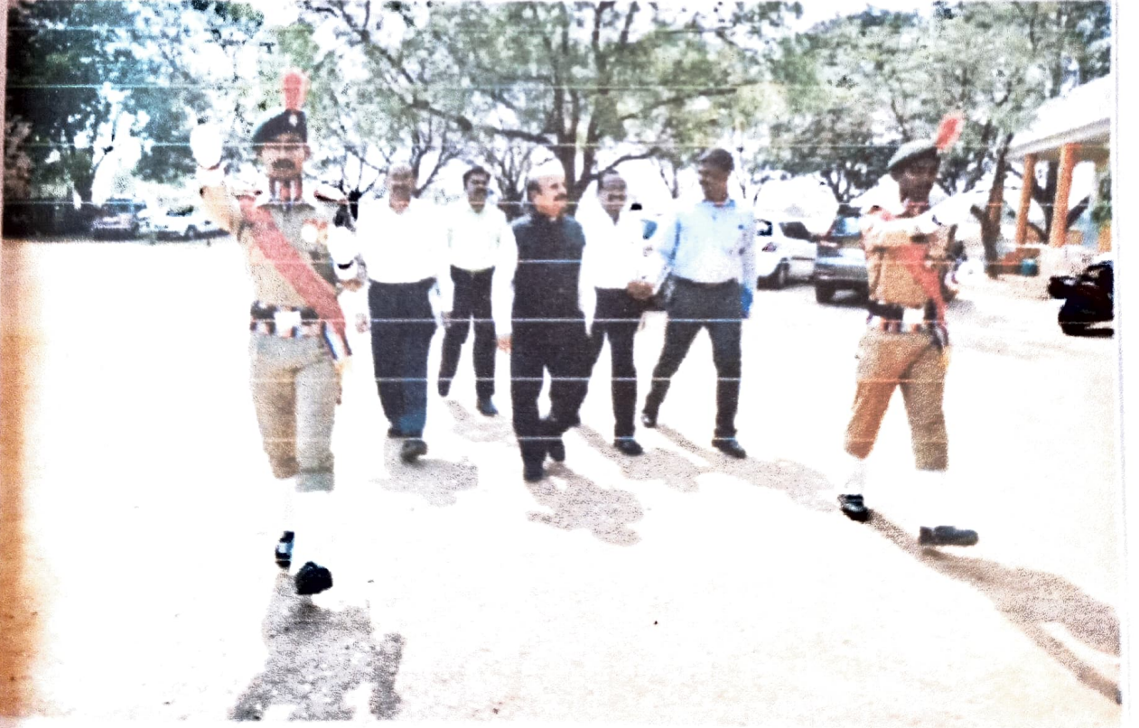
ವಿಚಾರ ಸಂಕಿರಣಕ್ಕೆ ಆಗಮಿಸುತ್ತಿರುವ ಮುಖ್ಯ ಅತಿಥಿಗಳು