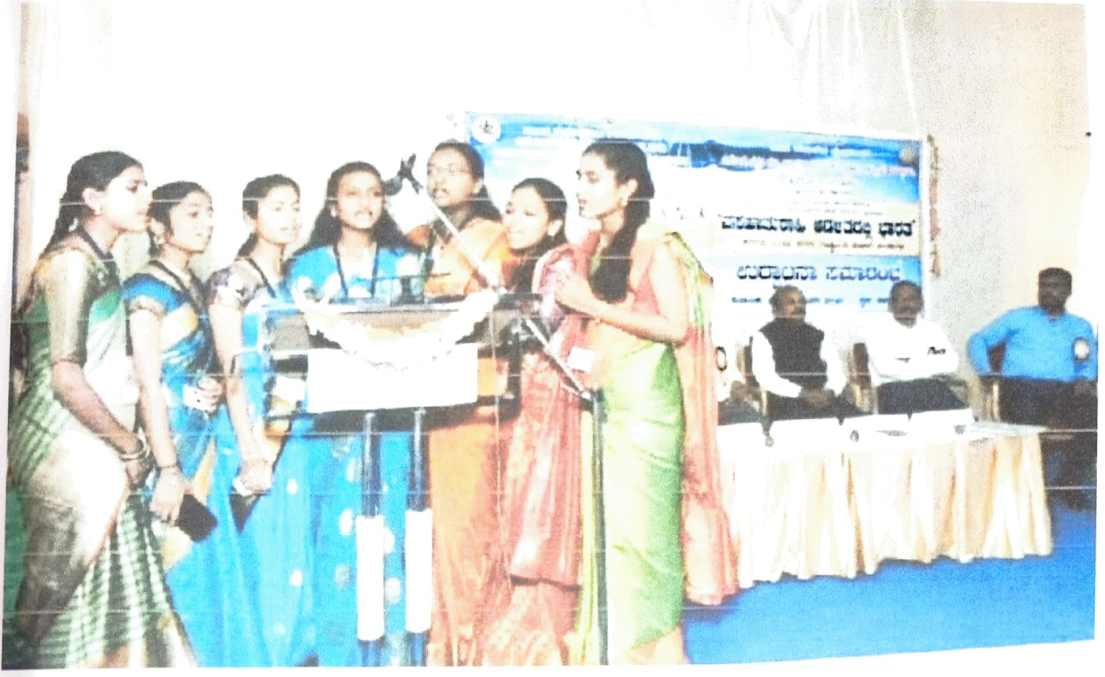
ವಿಚಾರ ಸಂಕಿರಣದ ಉದ್ಘಾಟನಾ ಸಮಾರಂಭದಲ್ಲಿ ವಿದ್ಯಾರ್ಥಿನಿಯರಿಂದ ಪ್ರಾರ್ಥನೆ