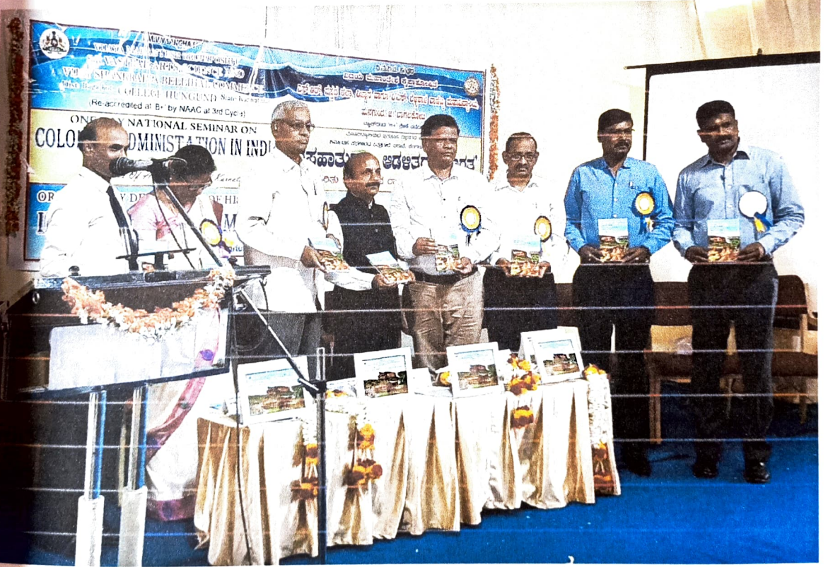
2019 ರ ವಿಚಾರ ಸಂಕರಣದ ಲೇಖನಗಳ ಪುಸ್ತಕ ಬಿಡುಗಡೆ ಮಾಡುತ್ತಿರುವ ಗಣ್ಯಮಾನ್ಯರು