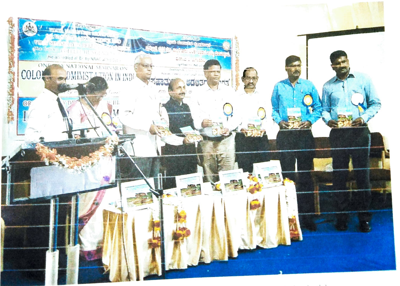
2019 ರ ವಿಚಾರ ಸಂಕಿರಣದ ಲೇಖನಗಳ ಪುಸ್ತಕ ಬಿಡುಗಡೆ ಮಾಡುತ್ತಿರುವ ಗಣ್ಯಮಾನ್ಯರು