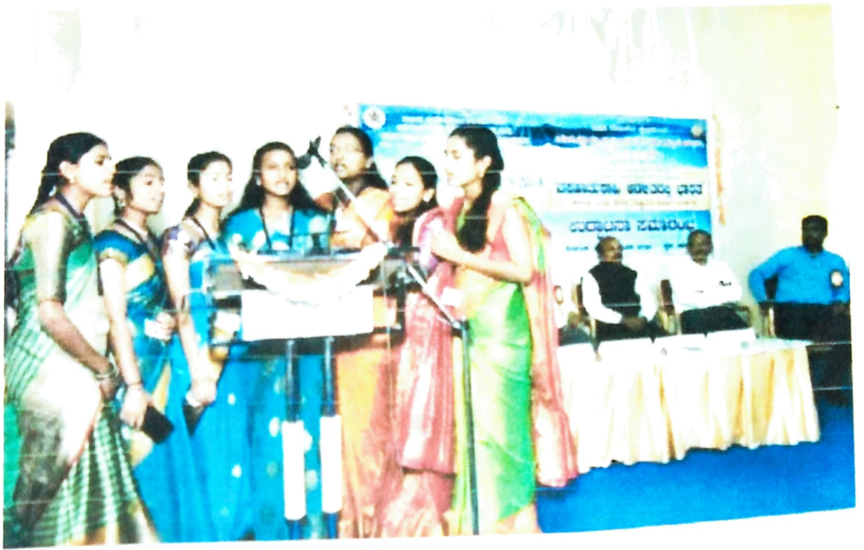
ವಿಚಾರ ಸಂಕೀರ್ಣದ ಉದ್ಘಾಟನಾ ಸಮಾರಂಭದಲ್ಲಿ ವಿದ್ಯಾರ್ಥಿನಿಯರಿಂದ ಪ್ರಾರ್ಥನೆ