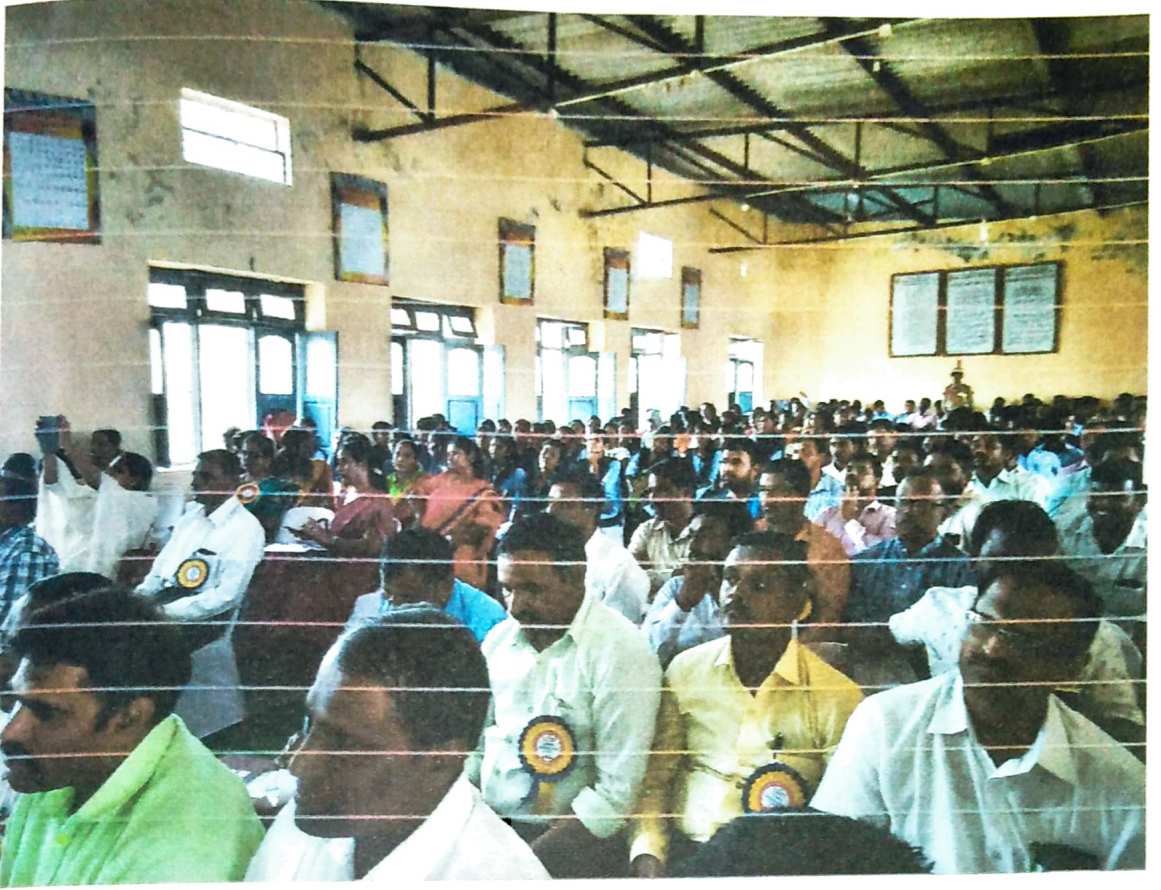
ವಿಚಾರ ಸಂಕಿರಣದಲ್ಲಿ ಪಾಲ್ಗೊಂಡು ಪ್ರಾಧ್ಯಾಪಕರು, ವಿದ್ಯಾರ್ಥಿಗಳು